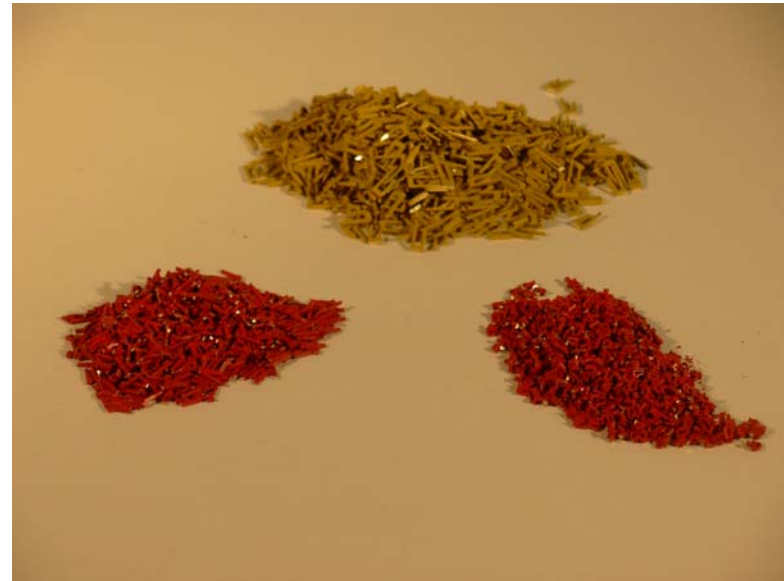
Kleinteile wie Zurrösen und Abstandhalter der Profildrähte, lackiert (ca 180 Teile)