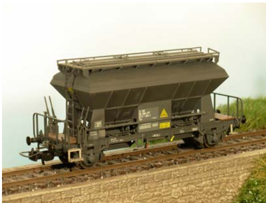
Foto des Prototyps